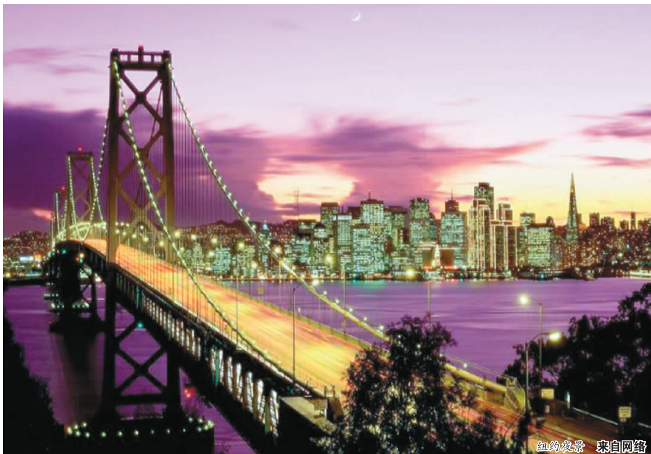
纽约夜景 来自网络