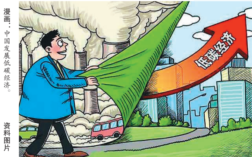
漫画：中国发展低碳经济。

英国广播公司网站指出，随着角色变化，面对新一轮气候变化多边谈判，中国的政治意愿不再欠缺。中国领导人习近平已多次走上前台，在多个重要场合就应对气候变化和加强环境保护作出承诺。