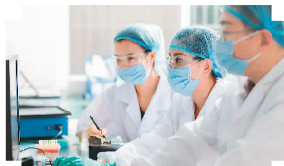
图为中国科研人员。

2016年5月30日，习近平参加全国科技创新大会时强调，我国要建设世界科技强国，关键是要建设一支规模宏大、结构合理、素质优良的创新人才队伍，激发各类人才创新活力和潜力。