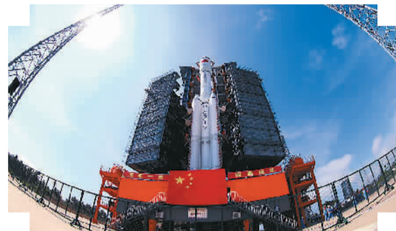
图为天舟一号货运飞船。

2016年4月24日，在首个“中国航天日”，习近平指出：探索浩瀚宇宙，发展航天事业，建设航天强国，是我们不懈追求的航天梦。