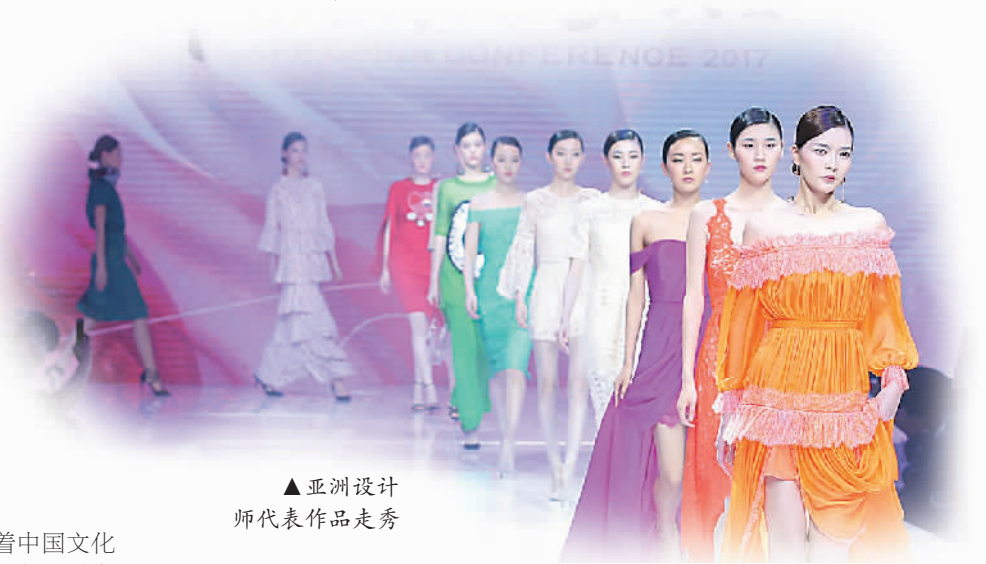
▲亚洲设计师代表作品走秀

在这种趋势下，亚洲设计如何拥抱世界？韩国设计师芮兰芝认为，欧洲有很多时尚元素，其实亚洲也有。现在在西方设计师对东方的文化非常感兴趣，他们认为从东方的文化当中可以吸取非常多的灵感。亚洲设计师应该对自己有自信。越南设计师哈灵邱表示，亚洲国家有着非常丰富的历史和文化，应该要从这些历史文化中创造出有特色的品牌，在全球范围内宣扬亚洲特色。中国设计师郭培认为，设计师应该有根无界，吸收我们自身文化的根，打破国家的界，这样才能蓬勃成长。