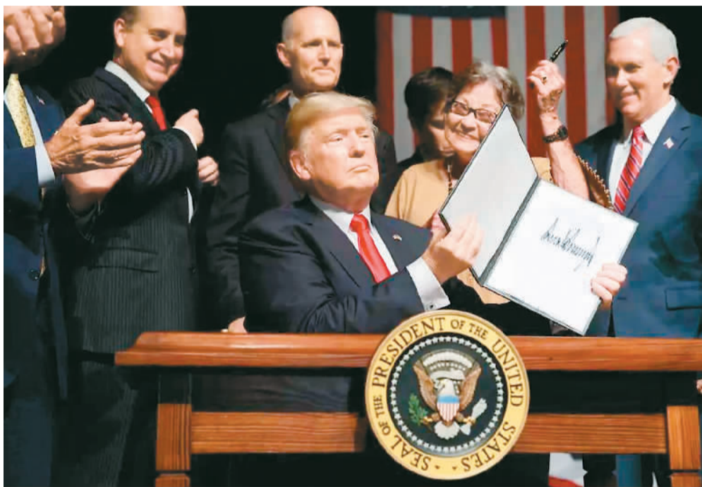
图为美国总统特朗普(中)签署文件。 资料图片

古巴断交的可能性不大。”袁征指出,一方面,特朗普刚刚宣布退出《巴黎协定》,加上此前退出TPP的决定,如果此次他再在美古关系上大动干戈,那将面临来自国际社会的巨大压力;另一方面,美国国内年轻一代的古巴移民大多支持美古关系正常化。