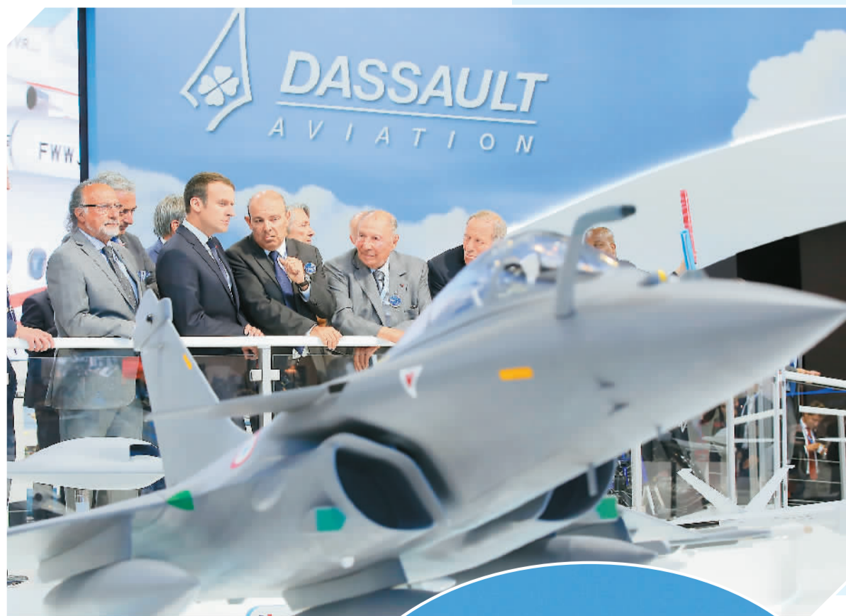
大图:6月19日,在法国巴黎近郊的布尔歇机场,法国总统马克龙(前左二)在巴黎航展上参观法国达索飞机制造公司的展位。

第52届巴黎-布尔歇国际航空航天展览会(巴黎航展)19日正式开幕。创始于1909年的巴黎航展是世界上规模最大和最负盛名的国际航空航天展览会之一,本届巴黎航展为期7天。