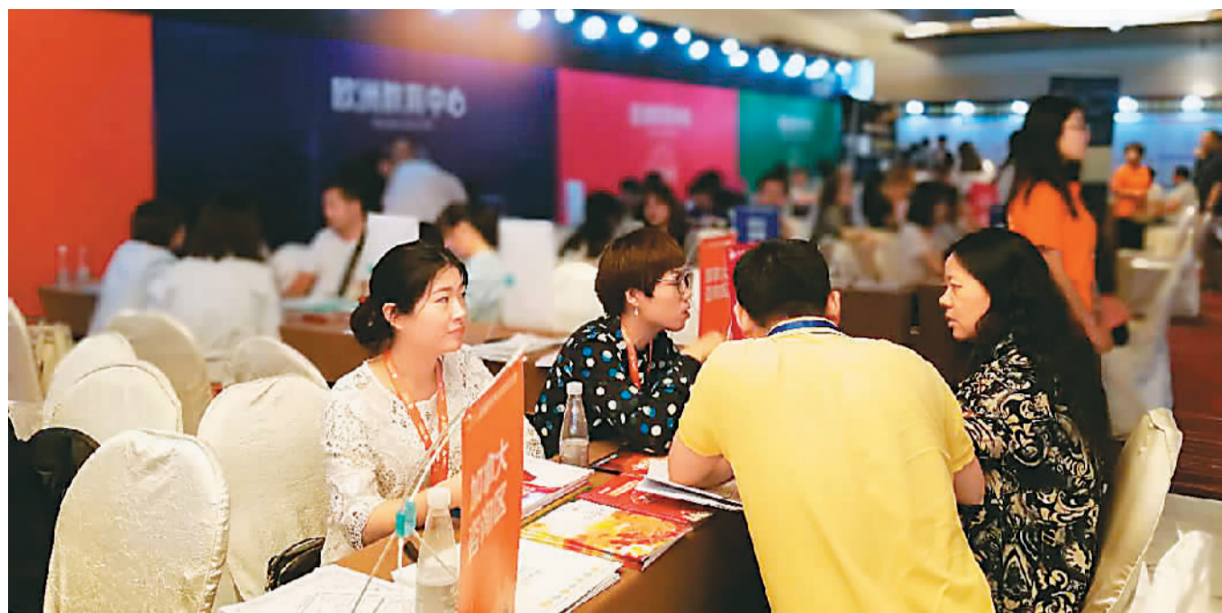
图为日前在启德教育集团举行的教育展上，家长在现场咨询。