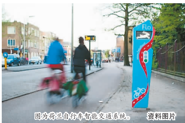
图为荷兰自行车智能交通系统。资料图片