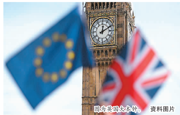
图为英国大本钟。资料图片

不过,保守党与北爱尔兰民主统一党合作也并非没有好处。崔洪建指出:“与苏格兰问题相近,接下来会影响脱欧的一大潜在阻力是北爱尔兰问题。如果提前和北爱尔兰民主统一党合作,就可以在很大程度上消解北爱尔兰问题,不会像苏格兰问题演变得那样严重。”