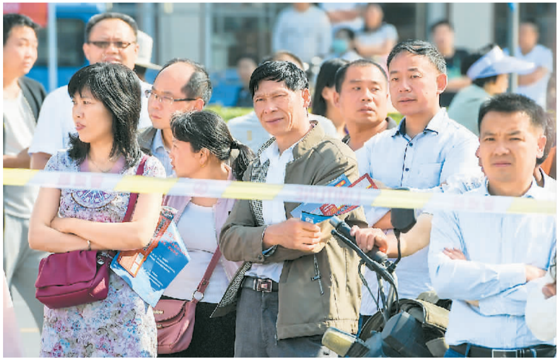
6月7日，家长在河南林州一中高校考点外等候考生。