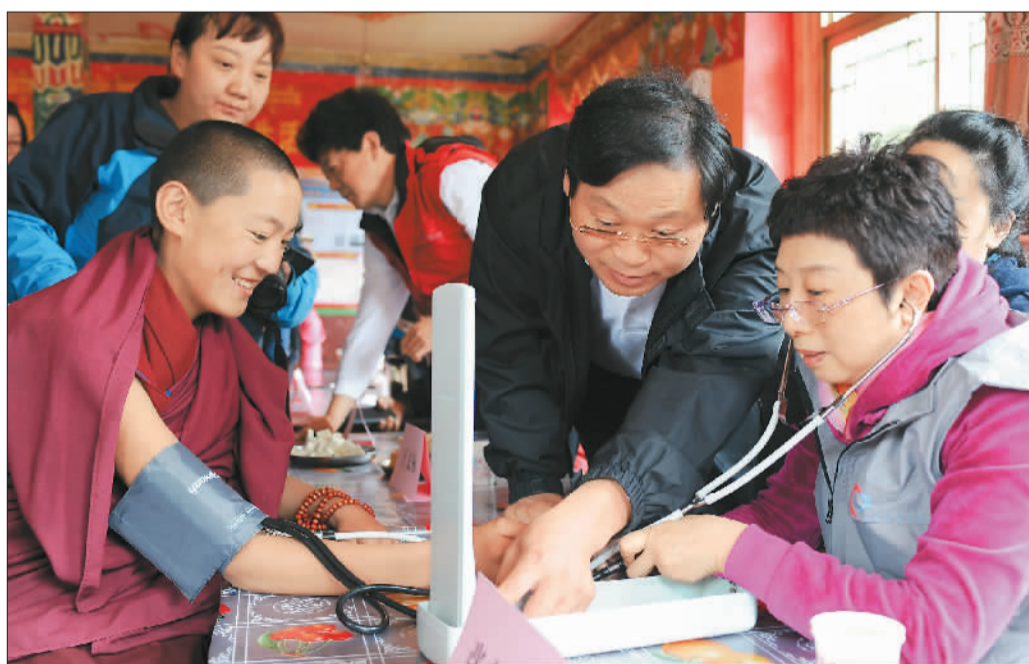
六月八日，“同心·共铸中国心”大型公益活动走进西藏林芝市，百余名来自首都医疗单位的医务志愿者在为僧人测量血压。