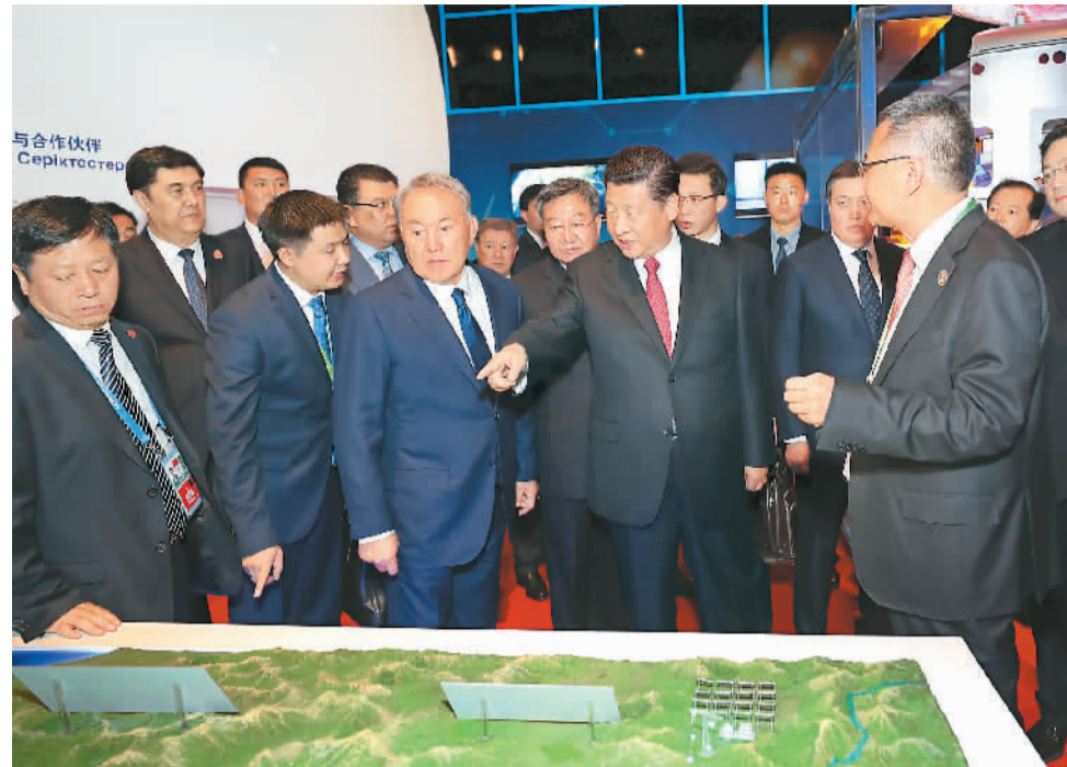
图为两国元首在中国国家馆全球使命与伙伴展区参观。

运班列的启动不仅惠及中哈两国，而且将为“一带一路”沿线有关国家创造更多运输便利和合作机遇，体现丝绸之路经济带和21世纪海上丝绸之路的有机对接。双方积极落实《丝绸之路经济带建设和“光明之路”新经济政策对接合作规划》。哈萨克斯坦已经从传统内陆国转型为亚欧大陆关键运输枢纽，在东西方贸易链中发挥日益重要的作用。中哈跨境运输合作的不断深化，将为地区发展繁荣贡献更大力量。希望双方继续通力协作，将连云港—霍尔果斯串联起的新亚欧陆海联运通道打造为“一带一路”合作倡议的