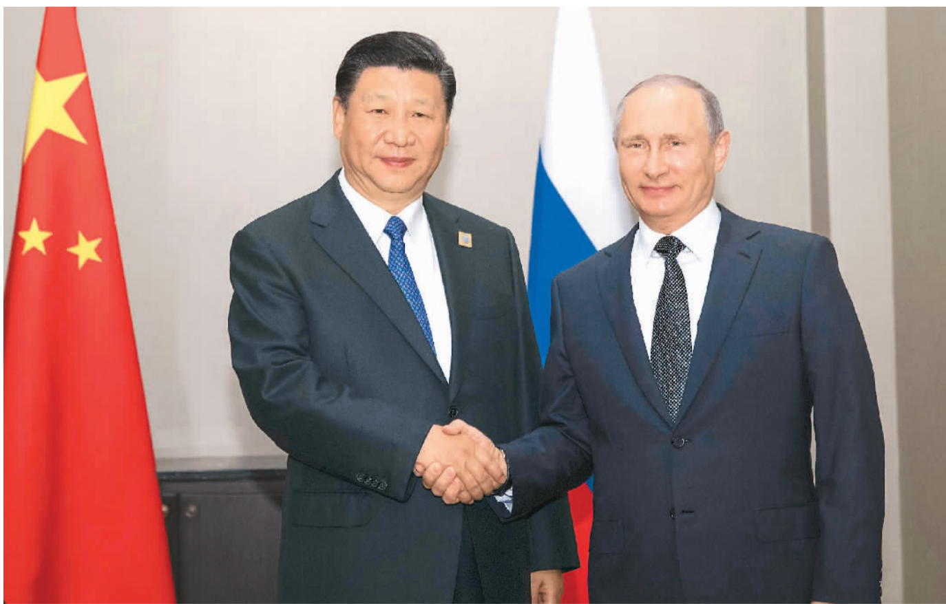
六月八日, 国家主席习近平在阿斯塔纳会见俄罗斯总统普京。