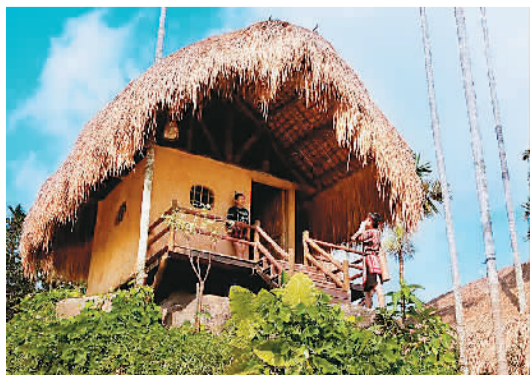
隆闰，黎族青年男女谈恋爱的地方

中华人民共和国成立后，特别是随着国民经济的快速发展，黎族地区的旅游业因其秀丽的自然风光和独特的人文资源快速发展。1986年1月，国务院宣布海南岛为全国7个重点旅游城市 and 地区之一，天涯海角、五指山、三亚等一批景点和独特的民族风情蜚声海内外。1988年4月，海南省正式成立。