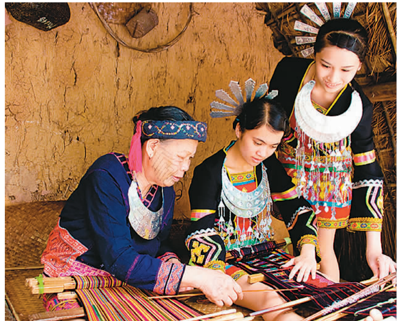
文身的阿妈与年轻姑娘一起参加黎锦竞赛