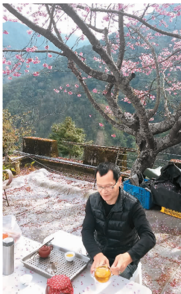
阿里山茶区的一位茶农在自家茶园泡茶。

赛后，梅山乡举办了免费品茶大会，将包括特等奖在内的所有得奖茶一字排开，让到场者品尝。一是展示好茶的滋味，二是为销售预热。