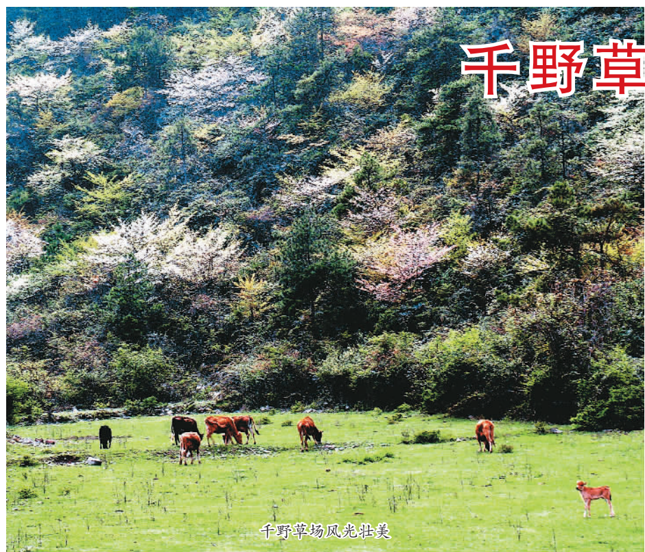
千野草场风光壮美