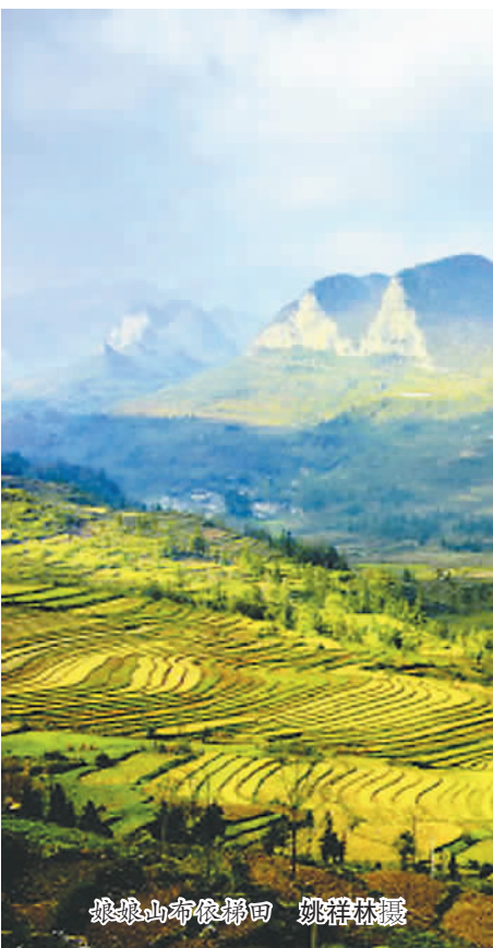
娘娘山布依梯田

忽然见远处梯田里有山民向我们挥手，我也扬起手回应起来。他们一定很奇怪吧，日常劳作的田野里，怎会有人憨痴痴地发起呆来？但我明白，自己已深深沉醉此景，娘娘山布依山寨梯田不仅养眼，更可养心。