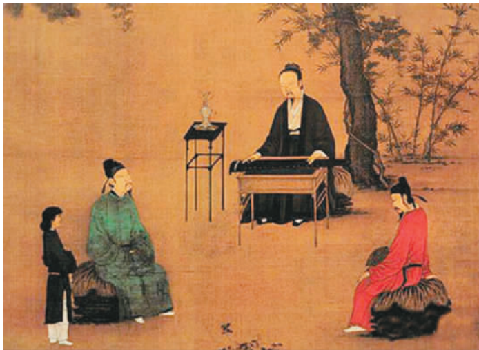
抚琴是古人重要的生活场景

凤和鸣……还有那些流传于世的曲目：风雷引、潇湘水云、平沙落雁、梅花三弄、胡笳十八拍……这些美意流转的名字，都在两本书里渐次浮现。但使舌尖滚上一滚，谁人纸上，听取琴意二三分？