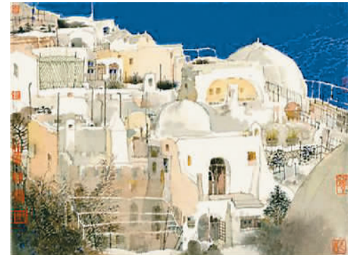
“一带一路”心灵的活动，灵魂的梦想 卢禹舜

熟悉卢禹舜的人都知道，他不太爱用言语表达自己，更喜欢用作品说话。近日，“‘一带一路’人类文明——卢禹舜中国画作品展”在中国国家博物馆举行。积数年之功，卢禹舜用中国画笔语展现了145幅“一带一路”写生创作作品，呈现了文化艺术在“一带一路”倡议中的独特魅力。