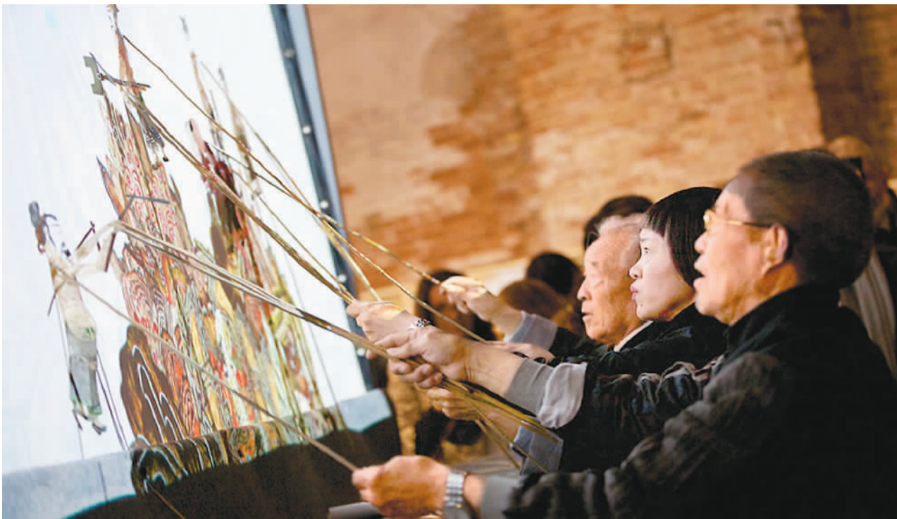
第57届威尼斯国际艺术双年展中国馆，艺术家在表演皮影戏。