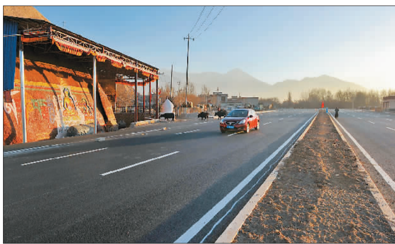
▲图为拉萨市环城路北环线部分路段。