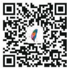
更多评论请关注“港台腔”