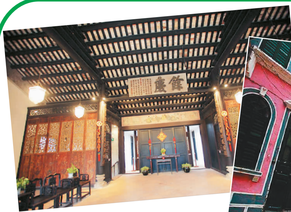
图为郑家大屋(左图)与恋爱巷(右图),体现着澳门中华传统文化与西方文化的兼容。 资料图片