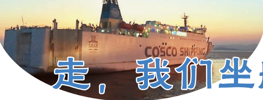
图为“中远之星”从浙江台州大麦屿港口出发时的场景。