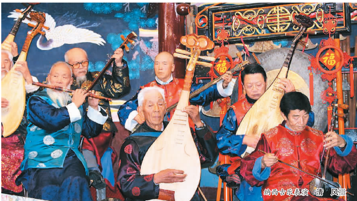
纳西古乐表演

新中国成立以后，国家在关心少数民族文化建设、大力扶持少数民族经济和文化发展等问题上采取了许多重要举措，取得了巨大的成就，这在全世界都堪称“风景这边独好”。白庚胜表示，在古代，纳西族因生活在茶马古道与古丝绸之路的连接地带而繁荣。如今，云南及丽江的发展也与“一带一路”战略紧密联结。全国、云南、丽江以及纳西等各个民族，只有积极融入“一带一路”建设，才能实现跨越发展，迎来当地及其民族文化发展的绝佳契机；只有融入大中华与世界文明，纳西文化的创新发展才有出路、才有未来。