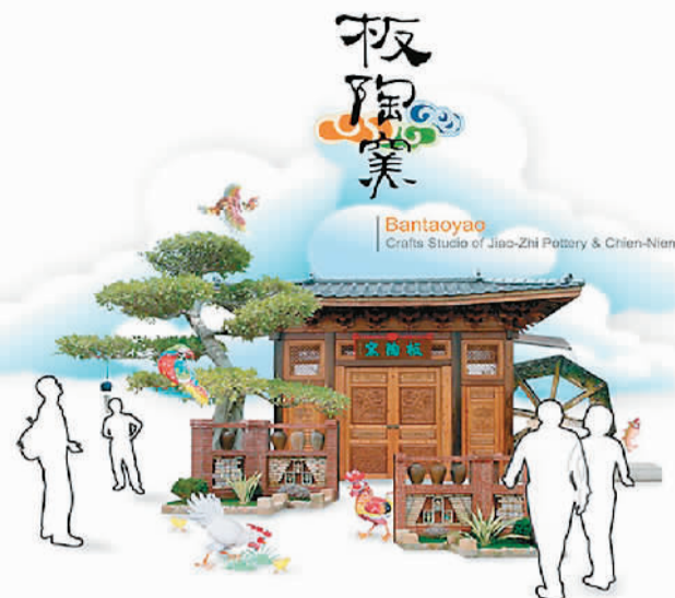
图为台湾板陶窑的海报。类似的“观光工厂”洋溢着浓浓的文创气息。

“观光工厂”使传统工业企业展现出新的生机和活力，日渐成为宝岛旅游的一张名片。台湾经济主管部门近日公布，全台湾共133家“观光工厂”，2016年度游客人次达2210万人次，总营收46亿元。