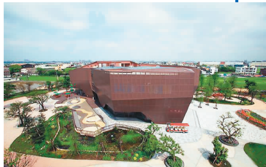
桃园的“巧克力共和国”就是一家远近闻名的“观光工厂”，图为充满造型创意的工厂外观。 资料图片