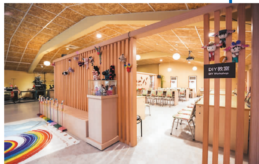
台湾“袜子王观光工厂”内景，让顾客有一种回家了的亲切感。 资料图片