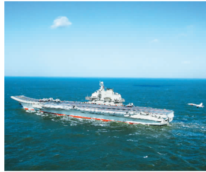
图为中国第一艘航母辽宁舰

对于网上的各种反响，环球网评论指出，国产航母下水，只是中国航母建设的第一步。“既不妄自尊大、更不妄自菲薄”，可能才是客观、冷静看待中国航母发展的有益态度。