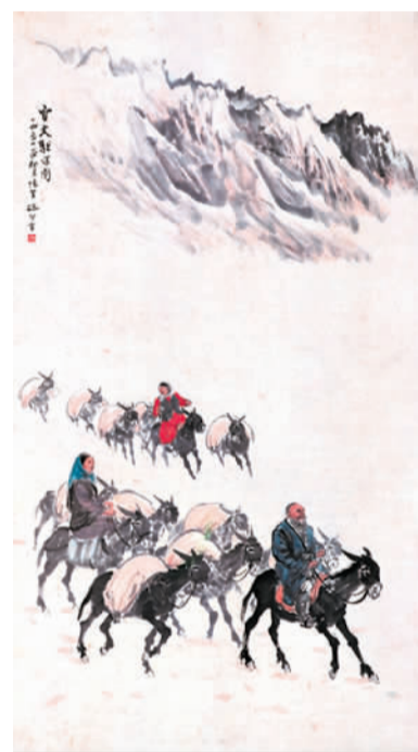
雪天驮运图 赵望云

“我是乡间人，画自己身历其境的景物，在我感到是一种生活上的责任，此后我要以这种神圣的责任，作为终生生命之寄托。”赵望云以“乡间人”的出身和视角，在塑造自我质朴、敦厚的内在骨气的同时，也使其对于农民生活和情感有着天然的亲近。从1932年开始，赵望云接受《大公报》委托进行“农村写生”活动，持续了数年，在行走中以自然、平易、朴实的艺术手法捕捉和描绘了大量农村生活实景。这些作品图文相应，强调绘画的情节性与文学性，犹如低声沉吟的乡村民谣，以其强烈的忧患意识和明白晓畅的宣传作用，激发着广大民众在战乱岁月的深沉共鸣。