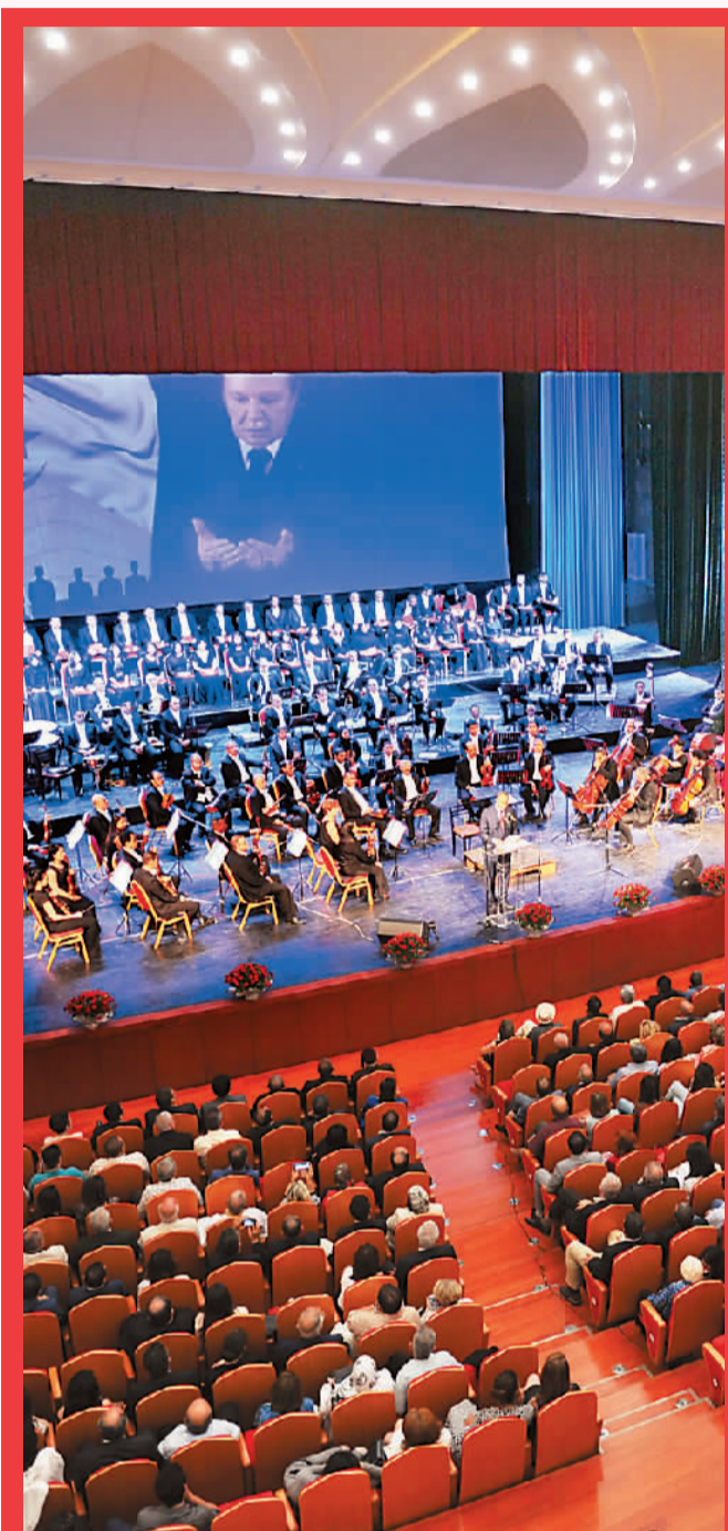
中国援建的阿尔及尔歌剧院，属大型甲等剧场，能容纳1400名观众，是阿尔及尔条件最好的演出场所之一。 新华社发

“一带一路”的规模基本成型。据统计，2016年，“一带一路”沿线国家的经济总量为12万亿美元，约占全球经济总量的16%；“一带一路”沿线国家的对外贸易总额为71885.5亿美元，约占全球贸易总额的21.7%。