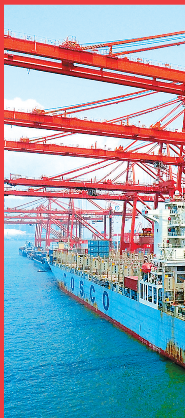
广西钦州保税港区规划总面积10平方公里，目前已建成11个码头泊位，开通15条国际集装箱航线，初步建成广西面向东盟的重要窗口和平台。

随着“五通”的深入便利，越来越多的国家和人民，对“一带一路”的体会更加深刻，“一带一路”，是一条合作之路，更是一条希望之路。它强调在理解和尊重基础上的共赢，为构建国际新秩序提供了一个可行的方案。