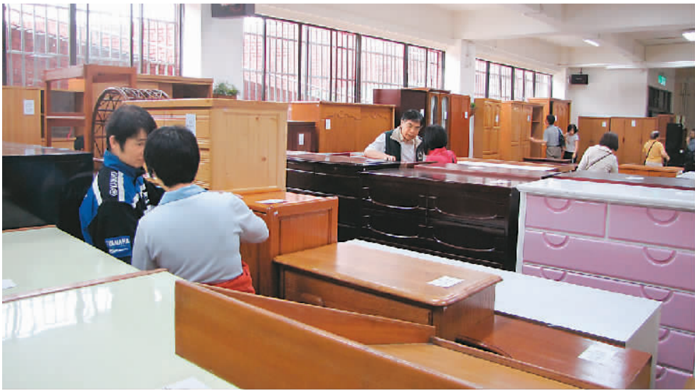
图为民众在仔细挑选合适的再生家具。