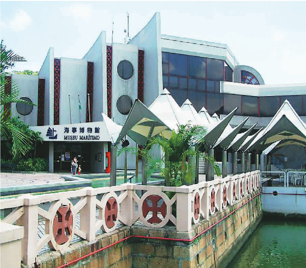
澳门海事博物馆外景。（资料图片）

了解过这么多航海和天文知识以后，你就可以当“船长”了！二楼平台上有一个轮船驾驶模拟舱，站在这里手握罗盘，眼望前方，体会一把“开船”的感觉，这趟“航海之旅”真是不虚此行。