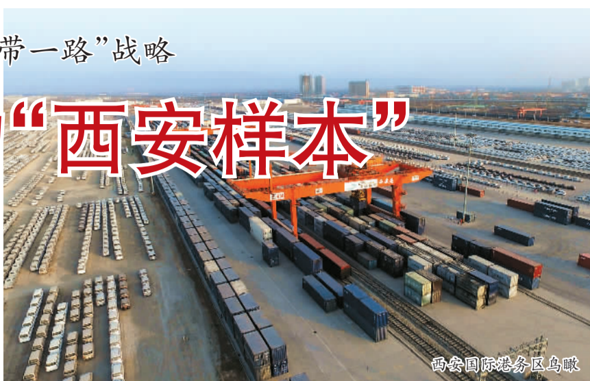
西安国际港务区鸟瞰