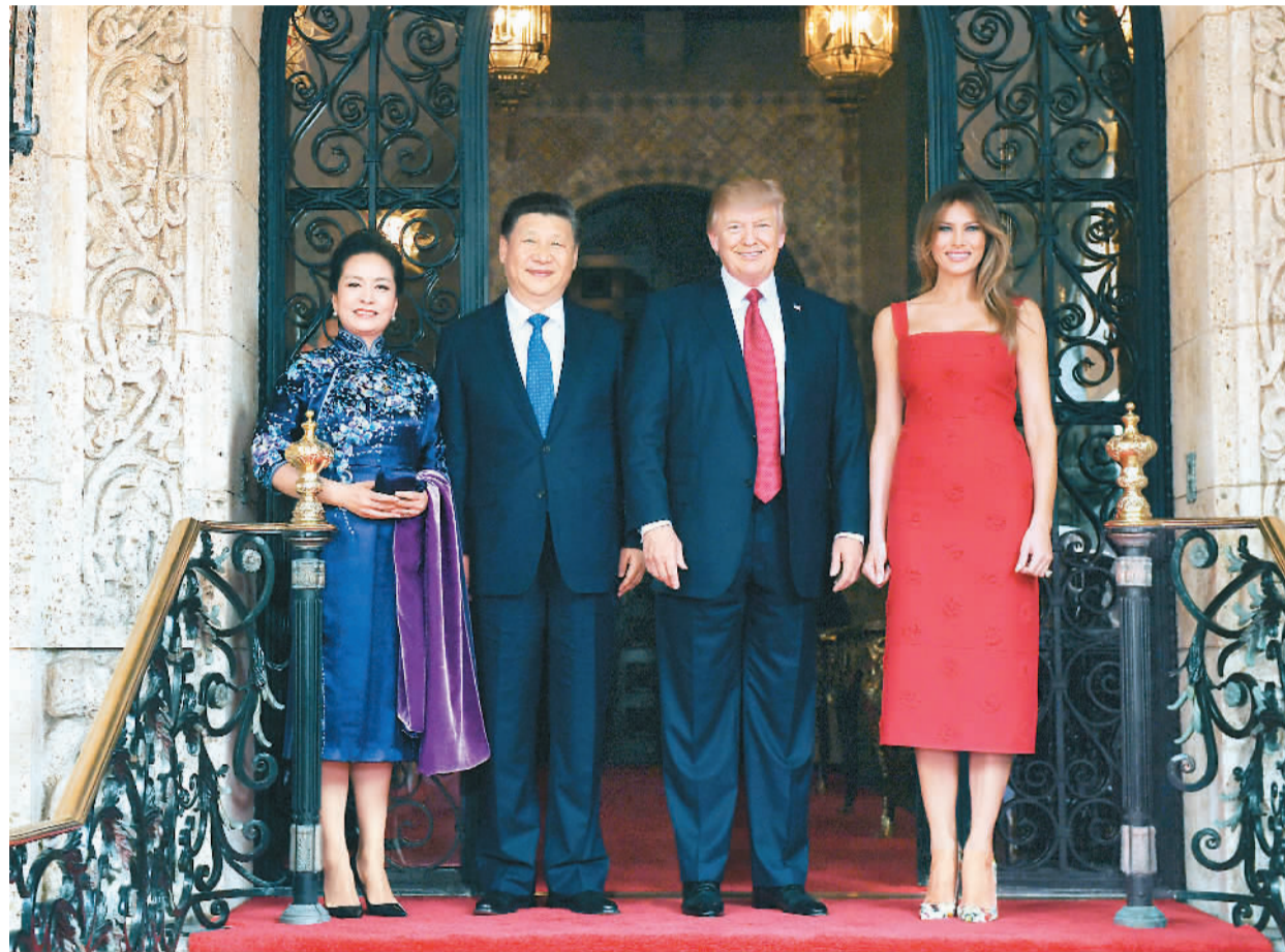
当地时间4月6日,国家主席习近平在美国佛罗里达州海湖庄园同美国总统特朗普举行中美元首会晤。图为习近平和夫人彭丽媛同特朗普和夫人梅拉尼娅合影留念。