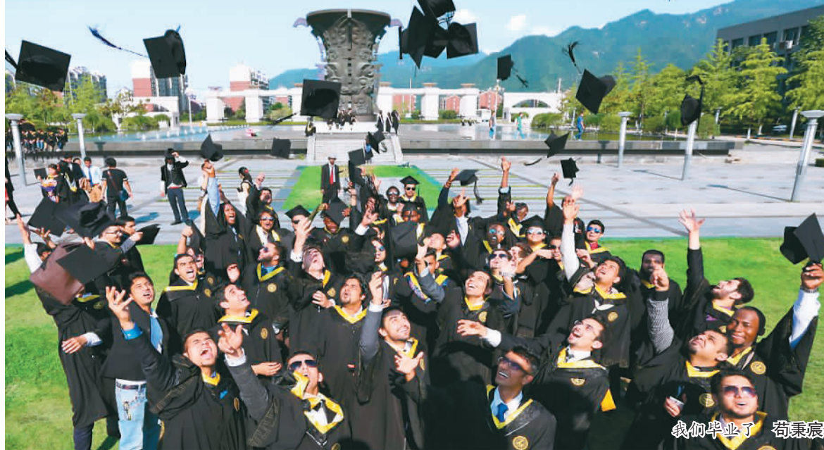
我们毕业了

“我们对留学生的认同教育也没有放松,国际班学生还自发组织成立了‘Shinning Team’志愿者服务队,创建了全英文报纸‘Bridge’,帮助留学生了解中国国情。”国际教育学院副院长孙武斌说。