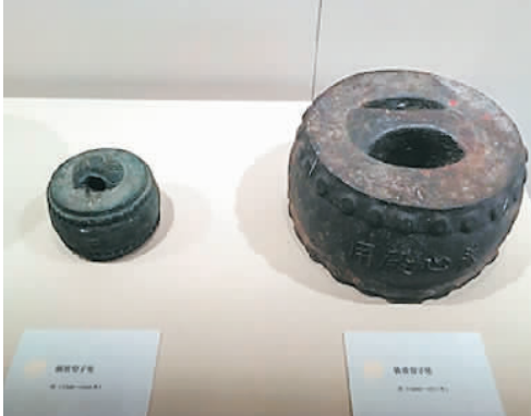
铁质、铜质帘子坠。

石座等进行了统计，共有51件残损不完整的。还配合收回了院内散落的构件，包括有琉璃构件、门栓、帘子坠、石构件、木构件、席席等。另外，还对古建筑及其附属物进行了登记，有些“顺带”进行了修复。例如，故宫开放路线的212件铜缸缸环，就都得到了加固。