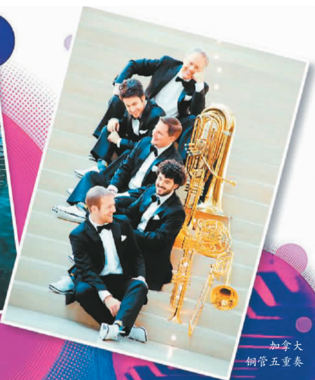
加拿大铜管五重奏