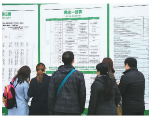
图为展会现场

谈起在教育展上,家长比孩子更加热情这个现象,中国教育部留学服务中心的相关人员告诉笔者:“父母更加热情已经成为一个特色了。因为孩子可以通过新媒体或者其他渠道去了解这些留学国家和学校的信息,他们对传统的展会可能就没有家长那么上心。而家长一般都讲究眼见为实,很多东西都得先看到以后才放心选择。因此,父母对这种传统方式的接受度会更高一点,在展会上就显得更加热情。”