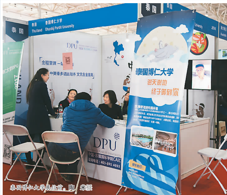
泰国博仁大学展位前。