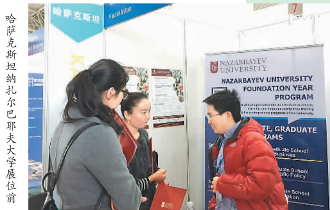
哈萨克斯坦纳扎尔巴耶夫大学展位前

解答疑惑,其中就包括留学安全。“阿联酋安全保障体系完善。我们曾做过学生调查,为什么来迪拜留学,很大原因是阿联酋安全。”沃伦·福克斯博士说。