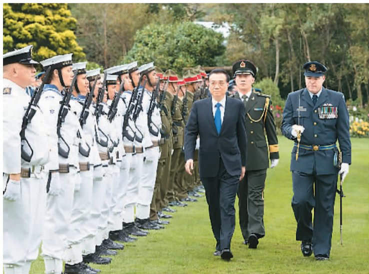
三月二十七日,李克强同新西兰总理英格利希举行会谈。图为会谈前,英格利希为李克强举行隆重欢迎仪式。

李克强强调,中新同为经济全球化和区域一体化的倡导者和受益者,应携手合作秉持联合国宪章宗旨和原则,坚定推动经济全球化进程,共同构建开放型世界经济,高举自由贸易旗帜,加强在亚洲基础设施投资银行框架下合作,加快推进区域全面经济伙伴关系协定(RCEP)谈判,为亚太和世界经济