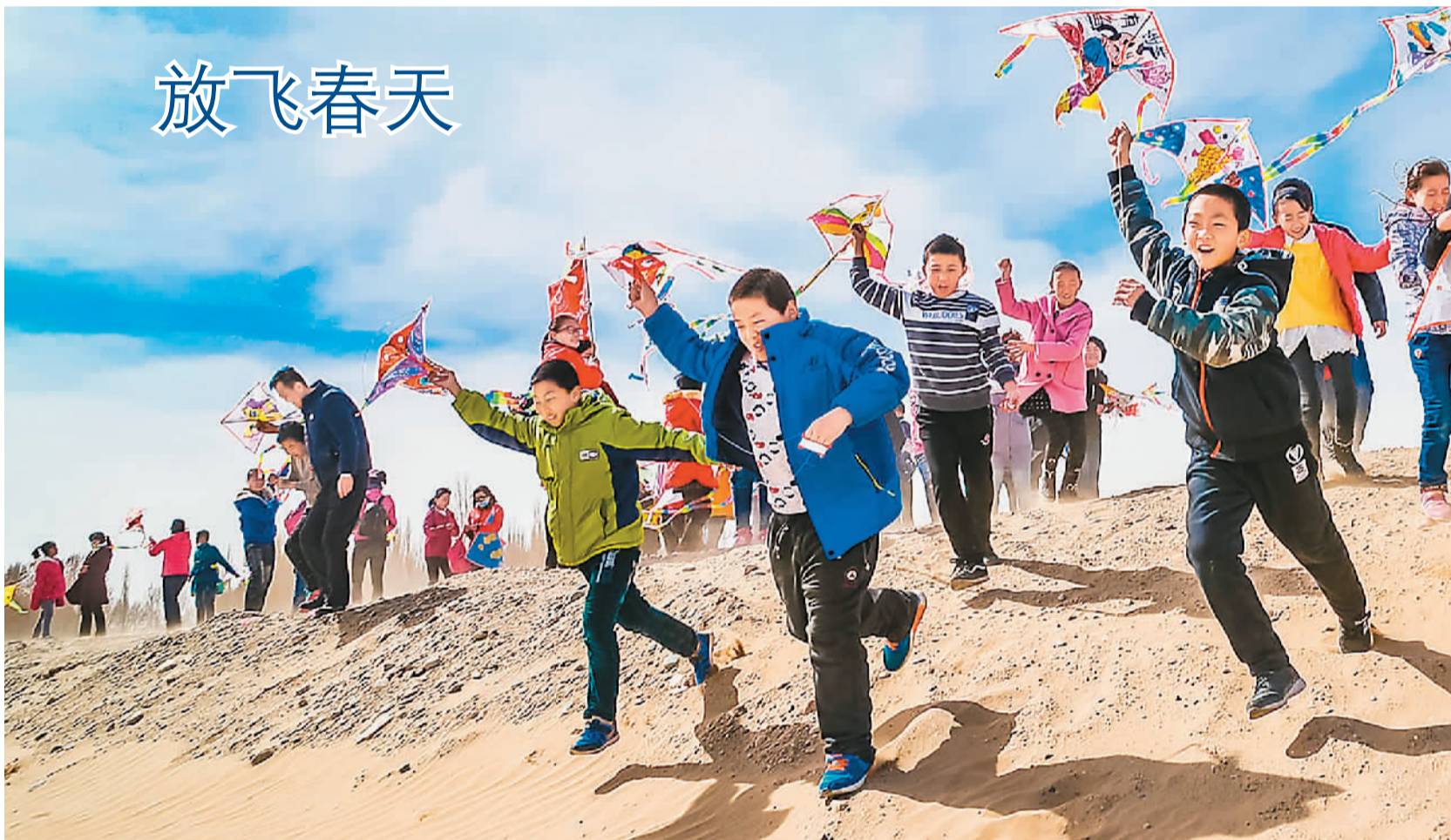
敦煌国际风筝节预选赛近日在风景秀丽的鸣沙山下进行,100多名小选手参加放风筝比赛。据悉,比赛入选的选手将参加4月8日在敦煌国际会展中心举办的敦煌国际风筝节正式比赛。图为小选手正在放飞风筝。

作为北京老城主体,东城区未来将打造南锣鼓巷、东四三条至八条等6片传统文化精华区,到2020年,历史文化街区整体修缮更新整治率将达到80%;西城区将力争实现一批重大文物建筑特别是纳入文物登记的会馆和名人故居腾退亮相。