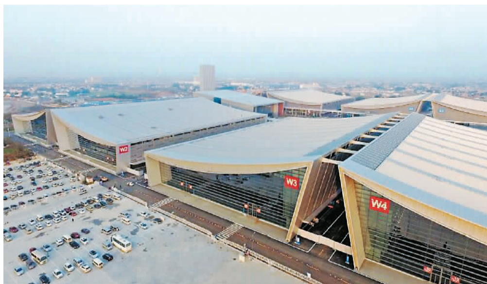
上图：长沙国际会展中心外景