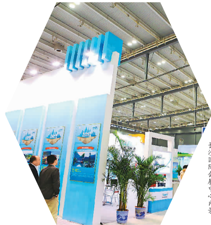
长沙国际会展中心内景

不到一个月时间，长沙县便以第一的“速度”和“姿态”，成立以该县主要负责同志为指挥长的“二次创业指挥部”。发轫之初，便是奋进崛起之时，作为湖南开放崛起排头兵的临空经济区吹响了“二次创业”主战场的号角。