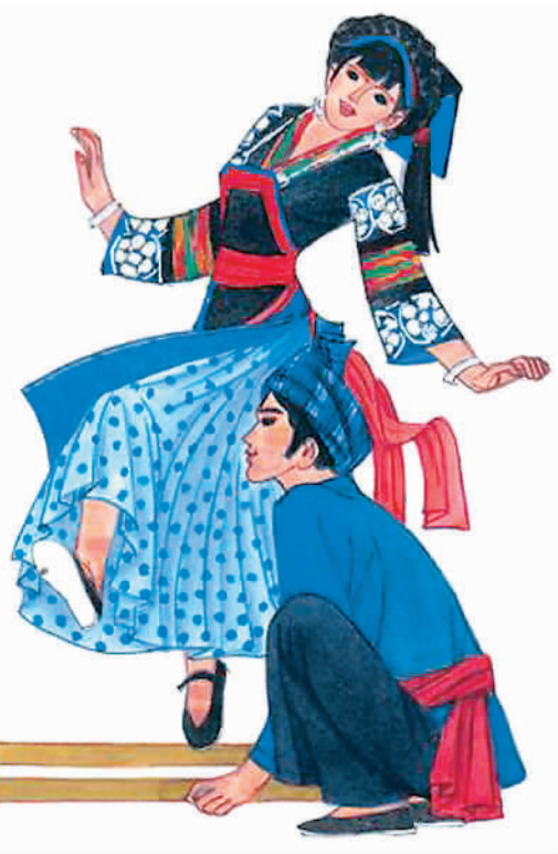
本版图片来自网络