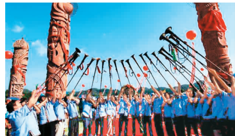
贵州贞丰六月六布依族风情节