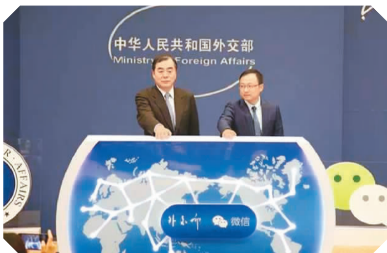
外交部部长助理孔铉佑（左）、腾讯公司副总裁曾鸣共同按下“12308微信版及小程序”启动按钮。

台而言，“12308微信版”除了推送热门资讯外，新增了“通知公告”和“侨报播报”两大类，将历史资讯收录其中，同时具有搜索功能，方便用户查询。