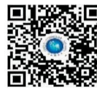
“外交部12308”小程序二维码