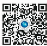
“领事直通车”二维码

打开小程序的方法有3种：一是线下扫二维码；二是通过微信搜索入口搜索精确的小程序名称；三是通过微信分享小程序。