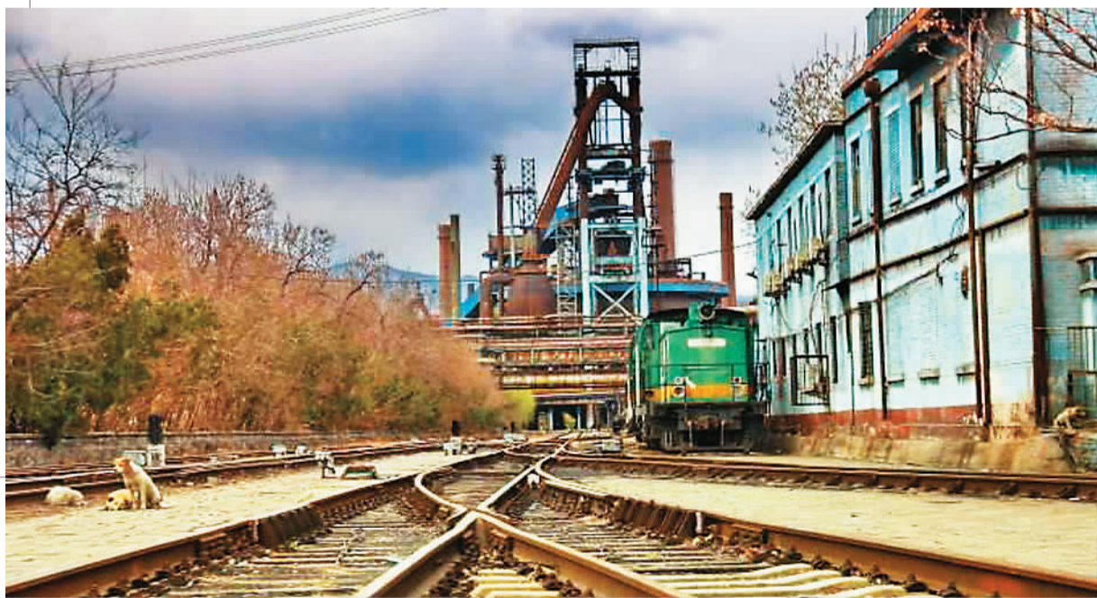
右图：首钢遗址公园

同时，这座雕塑也不是只能看不能用的。高炉内部将会做较大的修缮，除了保留原有的建筑工艺外，将被打造成展览展示的空间，用电子多媒体的方式，立体呈现当年炼铁时蒸腾的水汽、沸腾的铁水和火红的炉火，让参观者切身感受辉煌的工业文明。