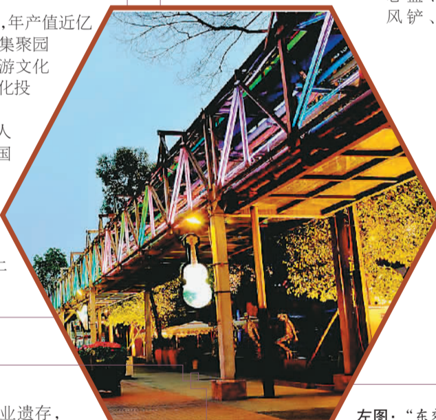
左图：“东郊记忆”内景

今年1月6日，中国东北老工业基地辽宁6日举行国际蒸汽机车展览活动，21辆在全球存世不多可正常运行的蒸汽机车与中外游客见面。当日，千余名海内外游客来到辽宁铁法能源蒸汽机车博物馆。在寒冬初升的朝阳下，一辆上游型蒸汽机车从远方鸣笛驶来，车头不断喷涌标志性的白烟，穿梭于白雪掩映下的山岭和平原，这一壮观的景象引来不少游客拍照留念。