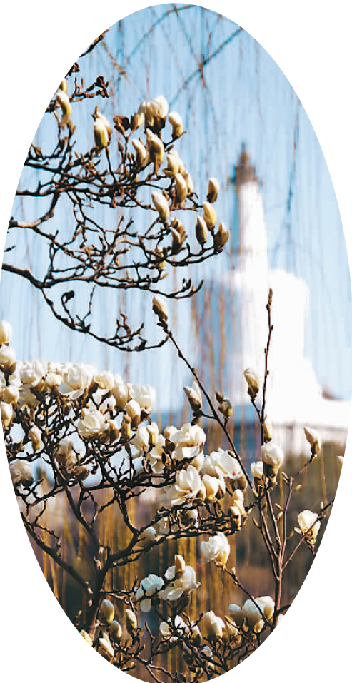
北京北海公园的白塔和盛开的玉兰花。

今年春季出游最热门的踏青、赏花、爬山等主题贴合春季特征的选项，古镇、园林、乡村游、温泉度假区、动植物园、主题乐园等也非常热门。国内游最热门的目的地主要有桂林、丽江、昆明、大理、三亚、厦门、成都、重庆、苏州、无锡等；出境游热门目的地主要有泰国、越南、巴厘岛、马尔代夫、日本、英国、法国、意大利以及香港和澳门等，其中日本赏樱、港澳购物游、荷兰赏郁金香等春游线路人气较高。