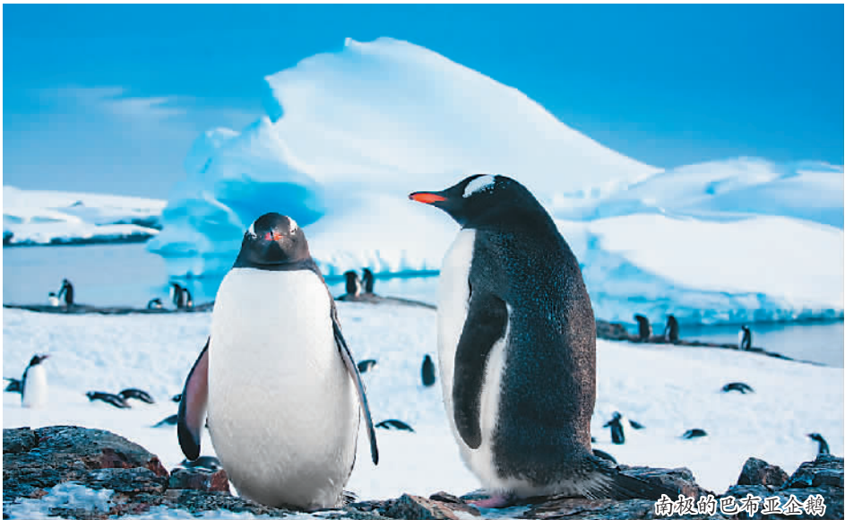
南极的巴布亚企鵝