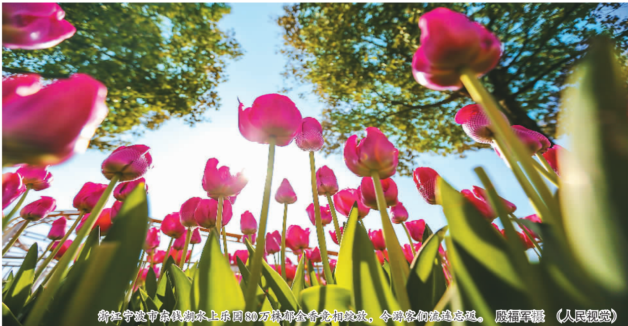
浙江宁波市东钱湖水上游园80万株郁金香竞相绽放，令游客们流连忘返。