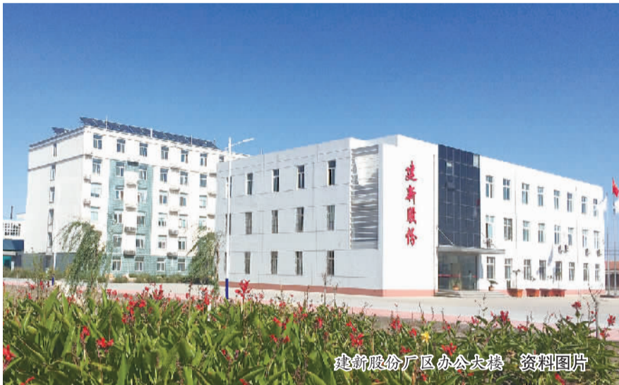
建新股份厂区办公大楼 资料图片

村，因此格外注重回报家乡，与乡亲们一起建设新农村。近三十年来，建新集团各类捐款累计达3600万元，为社会各界提供岗位2200多个。建新集团深深认识到环保对于企业和社会的重要性，近年来在环保方面累计投入1.36亿元。今后建新集团将继续坚持走绿色环保、循环利用、可持续发展的道路，做环境友好型、资源节约型企业。