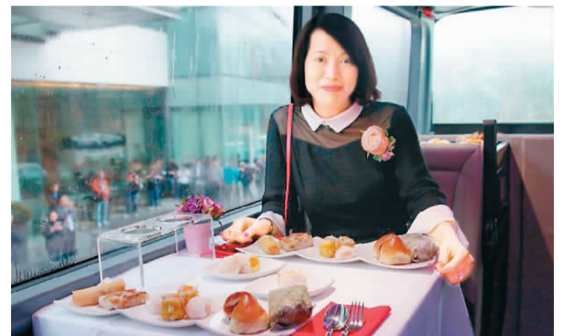
香港水晶巴士餐厅3月14日在沙田凯悦酒店举行启动礼。水晶巴士是双层观光巴士餐厅,将在香港市中心行驶。巴士内配有高质量音响设备,并提供不同米其林餐厅的菜肴。这辆水晶巴士在3月15日正式投入服务。图为拍摄的水晶巴士下层内部。