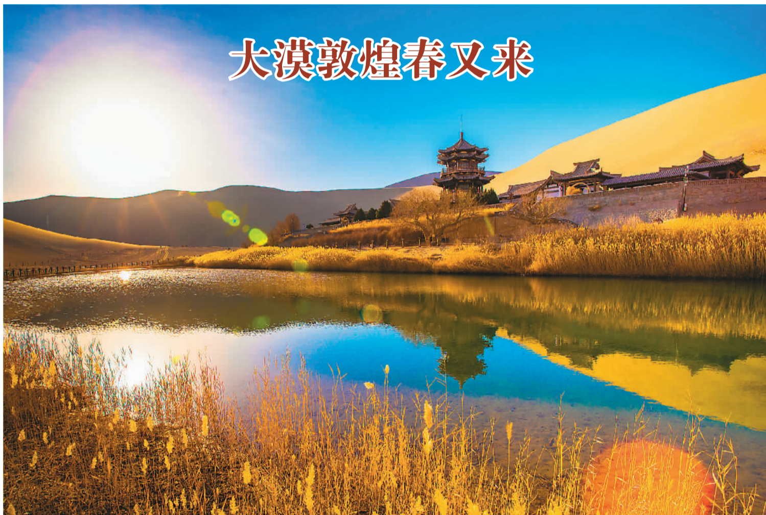
3月9日，甘肃敦煌天气晴朗，艳阳高照，游客来到敦煌鸣沙山月牙泉景区骑骆驼、看日出，尽情体验大漠风情。图为日出时的月牙泉景色。