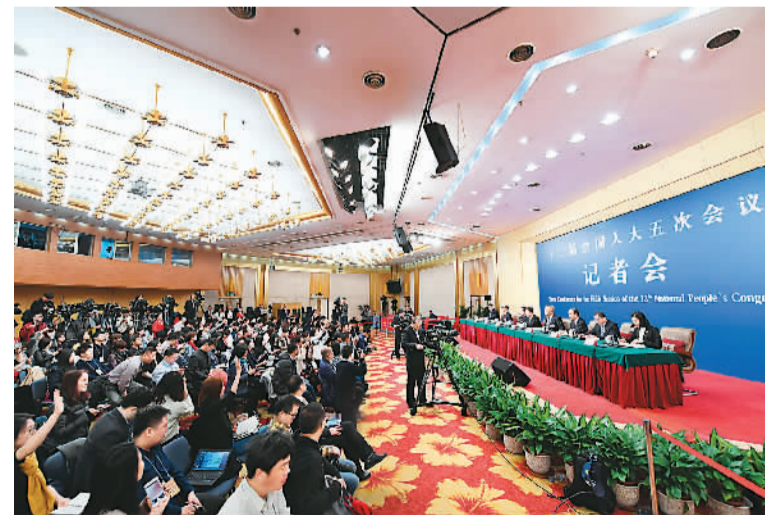
3月10日，十二届全国人大五次会议新闻中心举行记者会。