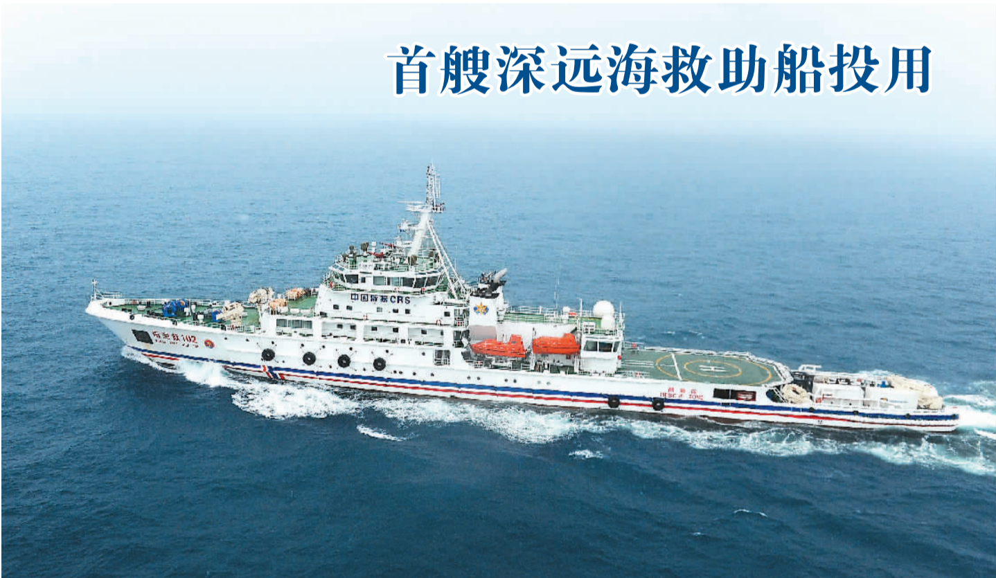
3月8日,中国第一艘具备深远海搜寻能力的专业救助船“南海救102”正式交付交通运输部南海救助局投入使用。这是中国自行设计建造的全天候大功率海洋救助船,船长127米、宽16米,满载排水量达7300吨,续航力达16000海里,是中国第一艘同时具备空中、水面、水下综合搜寻能力的海上专业救助船。