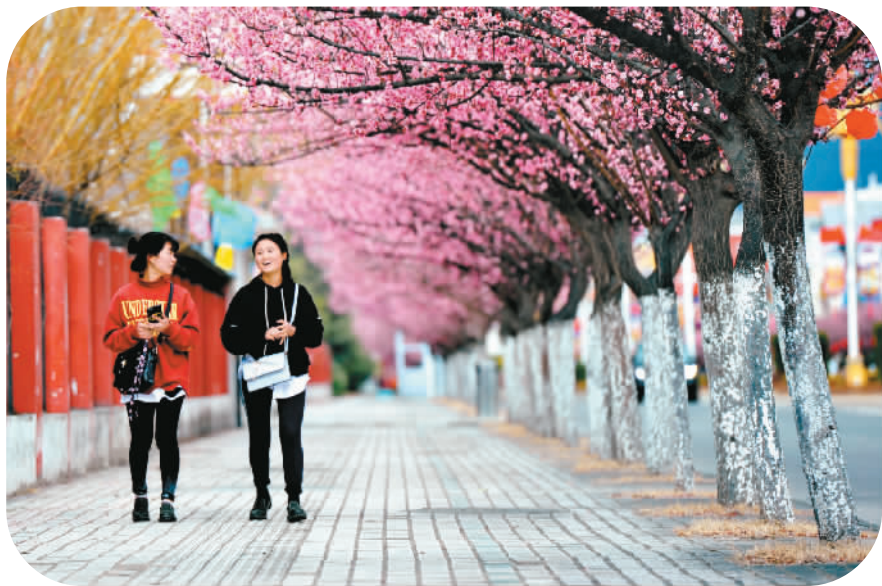
被誉为“西藏江南”的林芝近日冬梅绽放,翠柳抽芽,小鸟欢唱,人们徜徉在明媚的春光里。图为市民漫步在林芝市城区的林荫道上。