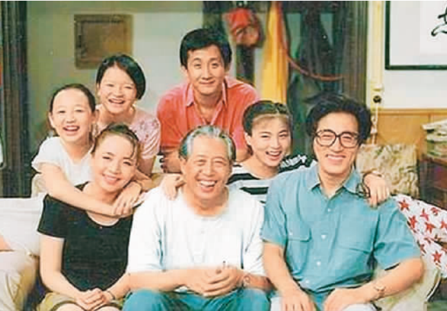
《我爱我家》剧照 资料图片