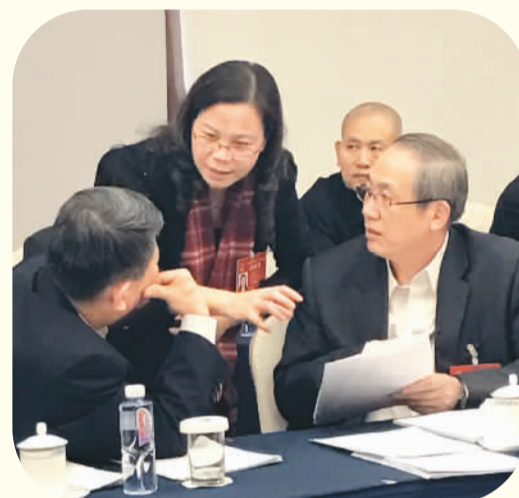
十二届全国人大五次会议广东代表团代表在讨论议案。