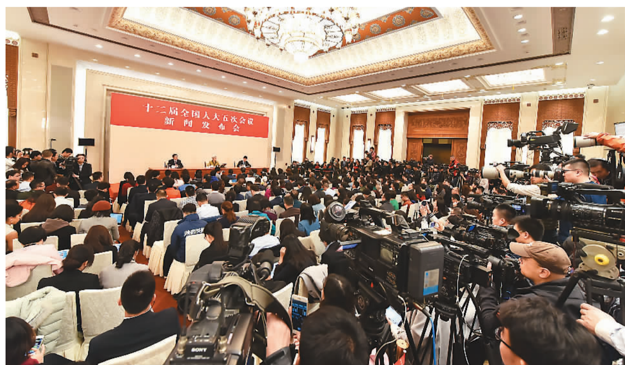
3月4日，十二届全国人大五次会议在北京人民大会堂举行新闻发布会。

傅莹表示，美国社会对中国还不太了解。“这次美国大选，每个候选人在谈到中国时，讲的都是老故事，或者是不那么真实的故事。”她希望此次报道中国两会的国际媒体，多关注中国的新故事。