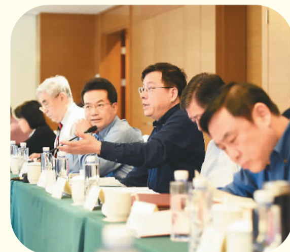
全国政协医药卫生界别组委员讨论政协常委会工作报告。本报记者 雷声摄