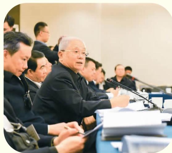
全国政协经济界别组委员讨论政协常委会工作报告。

全国政协科协界别举行小组会议，两名委员热烈发言讨论，认真履行职责。