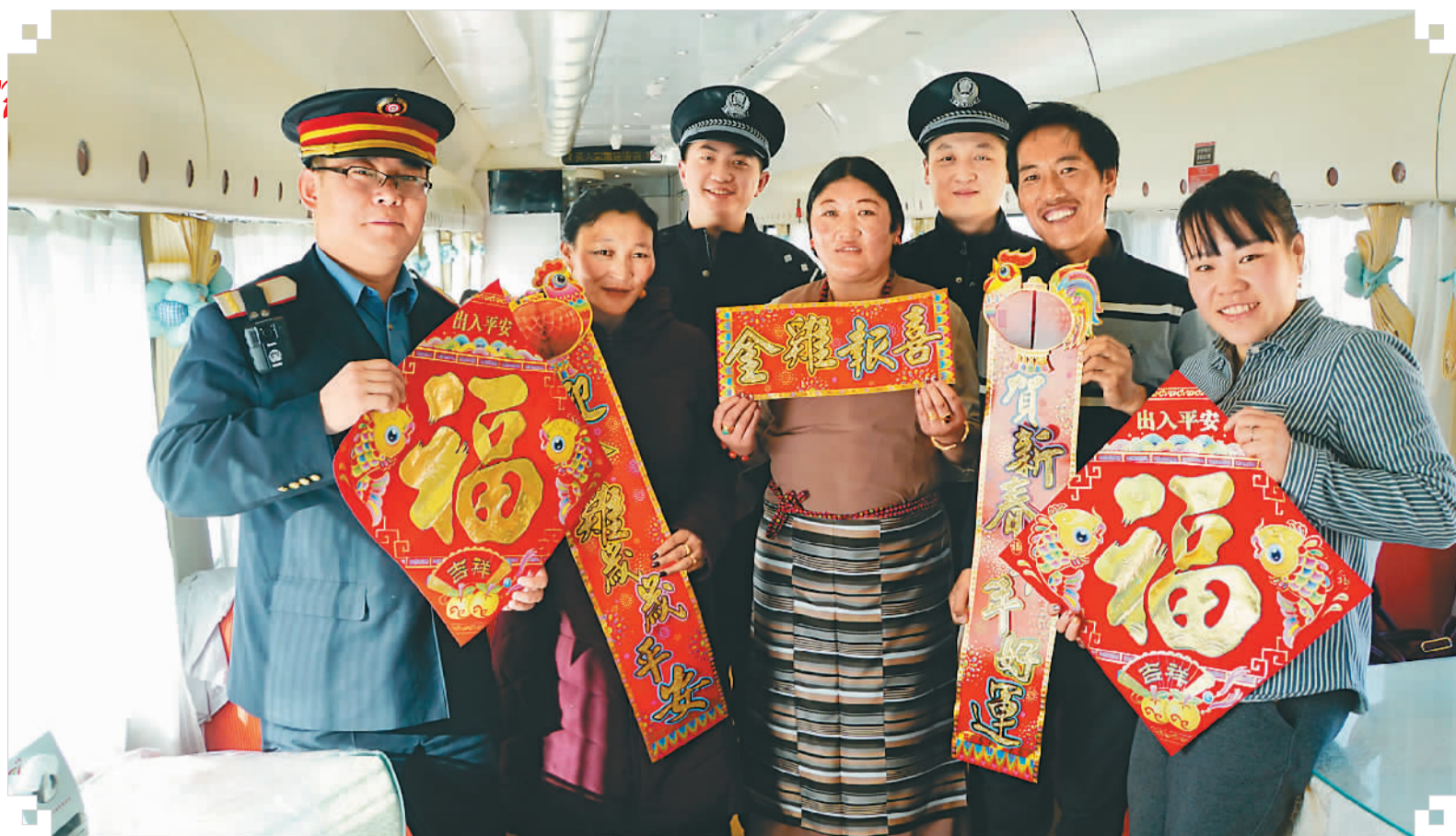
▲ 春联送给回家过年的藏族同胞后，乘务人员与之合影留念