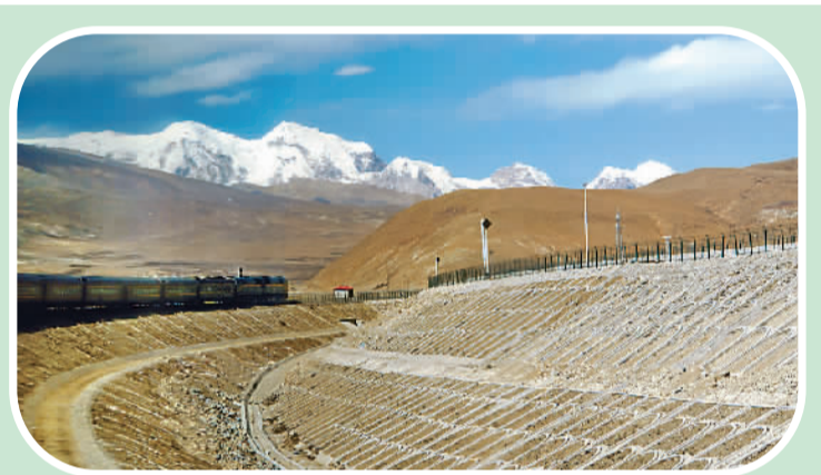
▲ 列车不断向前行驶

藏历新年一般从大年初一持续到十五。在广场或空旷的草地上，人们弹起弦子，围成圈儿跳锅庄舞，孩子们则燃放鞭炮。牧区的牧民们点燃篝火，通宵达旦地尽情歌舞，还进行角力、投掷、拔河、赛马、射箭等活动。