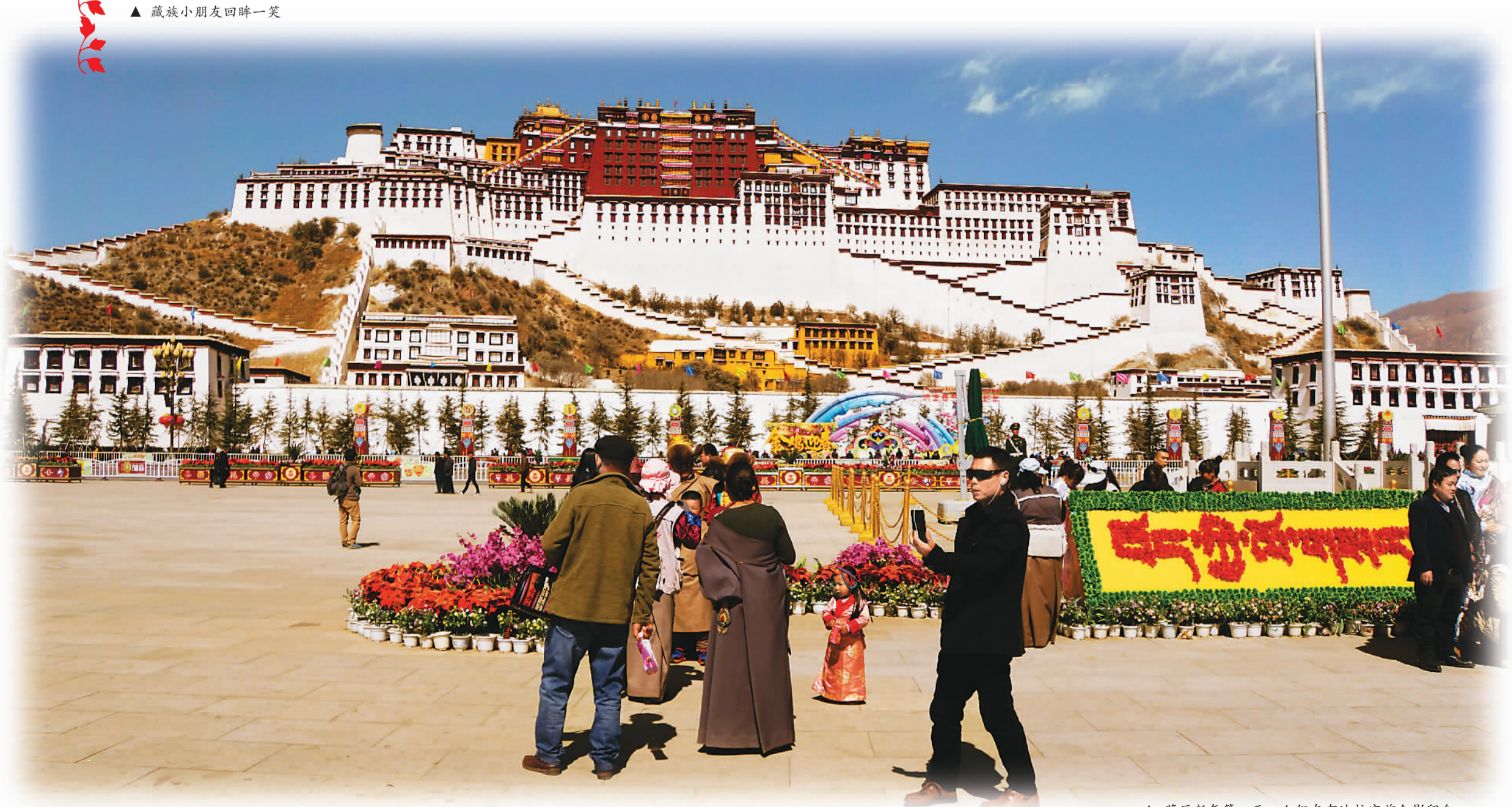
▲ 藏历新年第一天，人们在布达拉宫前合影留念