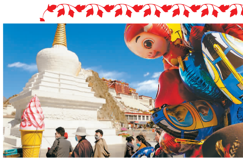
▲ 拉萨街头充满浓浓的藏历新年氛围