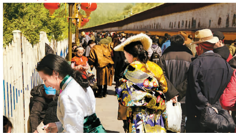
▲ 藏历新年第一天，拉萨街头人头攒动