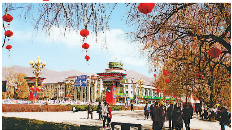
▲ 红灯笼高高挂在树上