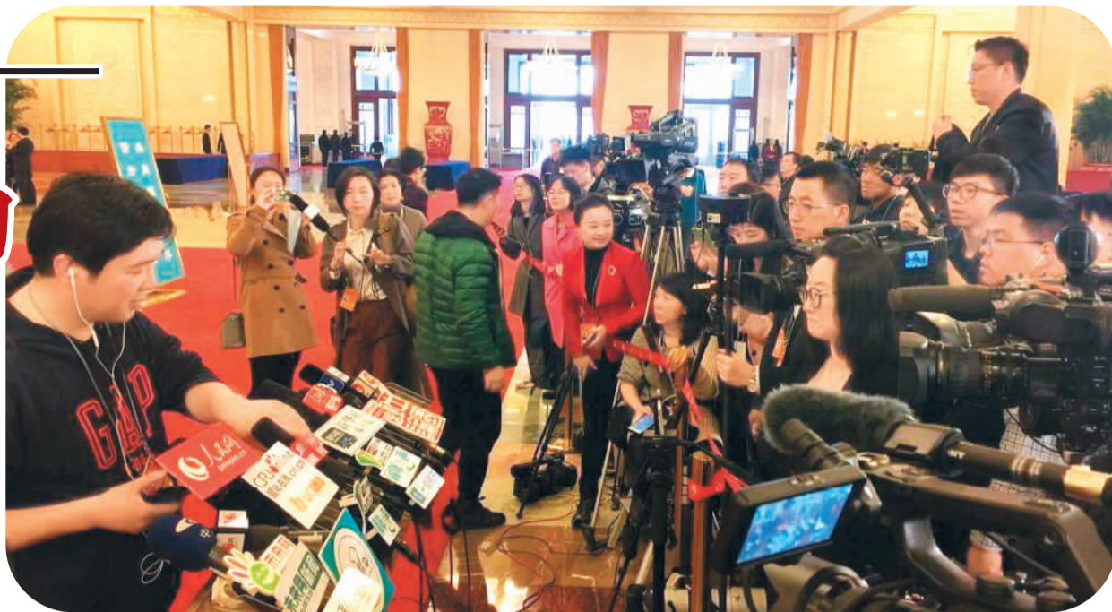
「新闻大战」准备。三月三日，采访全国两会的众多媒体在「部长通道」做人民图片。