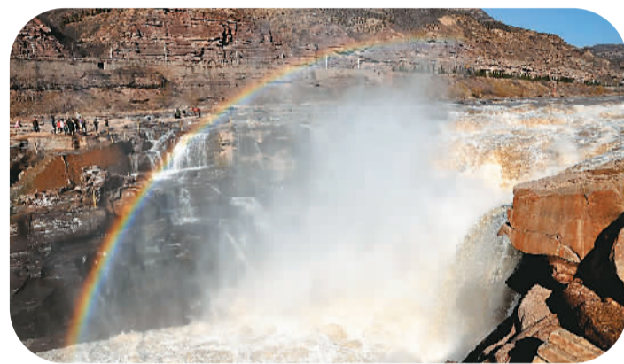
早春的壶口瀑布,彩虹高挂,浪花飞溅,气势磅礴,吸引了众多游客前来观赏。图为2月26日,游客在山西省临汾市吉县黄河壶口瀑布欣赏彩虹美景。