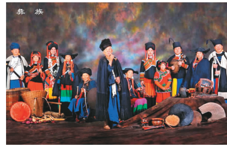
四川凉山彝族自治州美姑县巴普镇

彝族人民能歌善舞，音乐有歌舞音乐、口弦音乐、吹叶音乐，其中各有许多曲调，如爬山调、进门调、迎客调、吃酒调、娶亲调、哭丧调等。有的曲调有固定的词，有的临时即兴填词，各地山歌有自己独特的风格。彝族舞蹈也颇具特色，分集体舞和独舞两类，其中多为集体舞，如“跳歌”“跳乐”“跳月”“打歌舞”和“锅庄舞”等。动作欢快，节奏感强，通常由笛子、月琴、三弦伴奏。