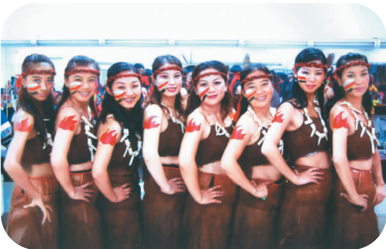
跳“罗婺神鼓”的孩子们

彝族主食型食物为土豆、玉米、荞麦、大米等，副食型食物有肉食类、豆类、蔬菜类、调料类、饮料类，肉食类以牛、羊、猪、鸡为主。豆类有黄豆、胡豆、豌豆