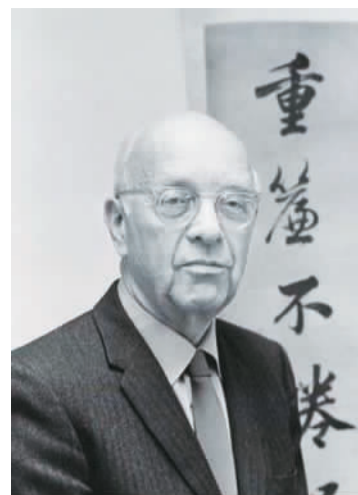
美国著名汉学家费正清

北京开卷信息技术有限公司是全球最大规模中文图书市场零售数据连续跟踪监测系统的建立者。2016年，开卷采样系统中实体书店采样规模稳中有升，网上书店采样规模持续扩大。截至2017年1月1日，采样已覆盖全国1205个城市、3053家书店，为图书市场的观察提供了权威数据。