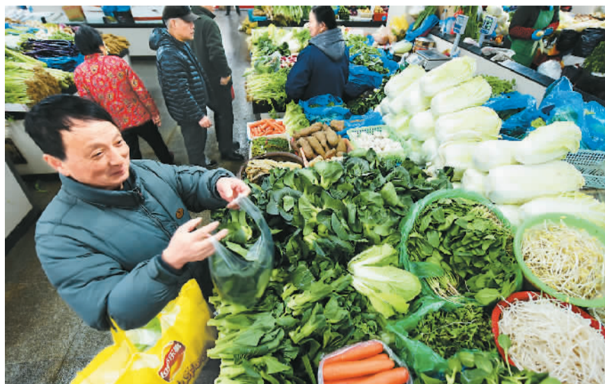
2月14日，顾客在浙江省杭州市一家超市选购蔬菜。

2月14日，国家统计局发布的1月份全国居民消费价格指数(CPI)和工业生产者出厂价格指数(PPI)数据显示，CPI环比上涨1.0%，同比上涨2.5%，二者涨幅均有所扩大；PPI环比上涨0.8%，涨幅回落，同比上涨6.9%，涨幅继续扩大。对此，专家指出，1月份CPI涨幅受春节等因素影响有所扩大，若剔除这些特殊因素，物价并没有出现大的波动，且依旧处在合理区间。就未来走势来看，CPI走势仍将总体温和、以稳为主，PPI涨幅也会逐渐平稳，二者不会造成大的通货膨胀压力。