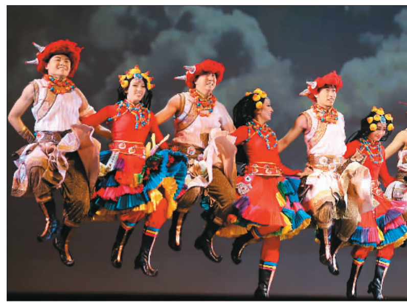
2月13日，“文化中国·四海同春”慰问演出在加拿大温哥华上演。图为演员在表演舞蹈《在那东山顶上》。