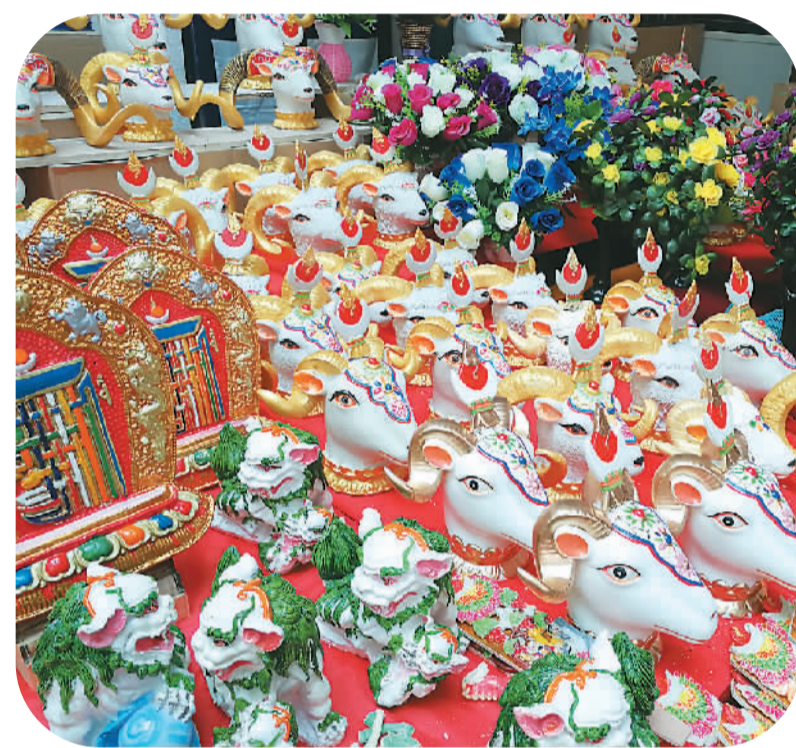
农历新春佳节刚刚过去，藏历火鸡新年的脚步正在临近，西藏各地的商场年货充足，购销两旺。2月26日至3月4日，拉萨市将放假调休7天。

随着节日气氛渐渐浓烈，拉萨市的八廓商城内人头攒动，市民在年货摊位前争相挑选。除了切玛盒、酥油花、炸卡赛等传统年货，绘满祝福和吉祥八宝的大红春联成为藏族同胞喜爱的新式年货。