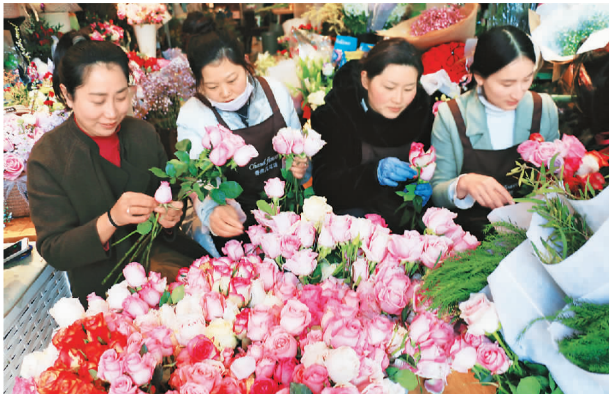
随着2月14日情人节的到来，各花店的情人节鲜花预订接单不暇，红玫瑰、康乃馨、百合、蓝色妖姬等主流节庆鲜花销售火爆。图为江苏省灌云县一家花坊店员在包装预订的情人节鲜花。