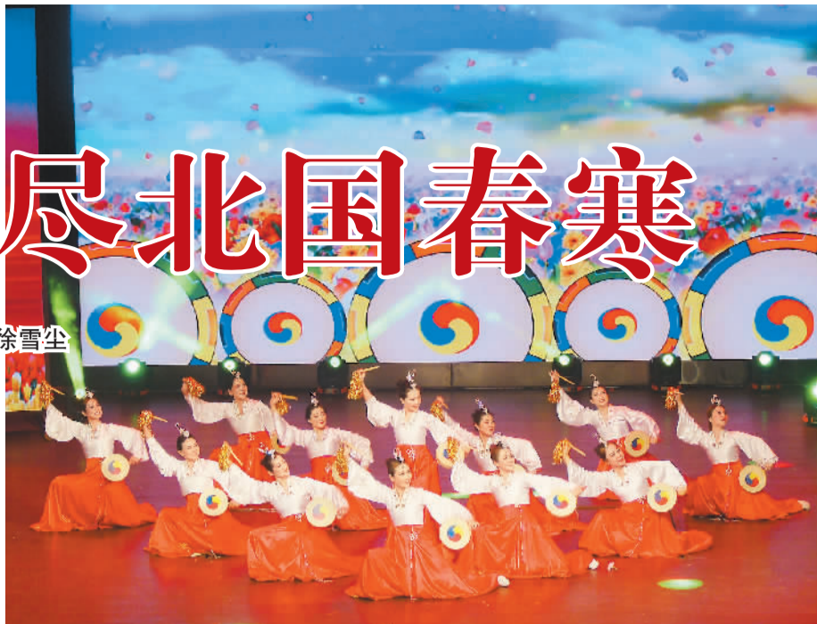
图为丹东市群众艺术馆群星艺术团演员表演朝鲜族舞蹈《边城鼓韵》。

近日,为期6天的2017“亲情中华·走进侨乡”慰问演出在辽宁沈阳落下帷幕。九州曙色金鸡唤,四海春风紫燕掀。在公主岭、通化、丹东、历史悠久的沈阳等地,艺术家们一场接一场的精彩表演和侨胞侨眷们一浪高过一浪的热情,让这份温情变得更加厚重。侨胞侨眷借着晚会互诉侨心意,让这初春的寒意一扫而尽。