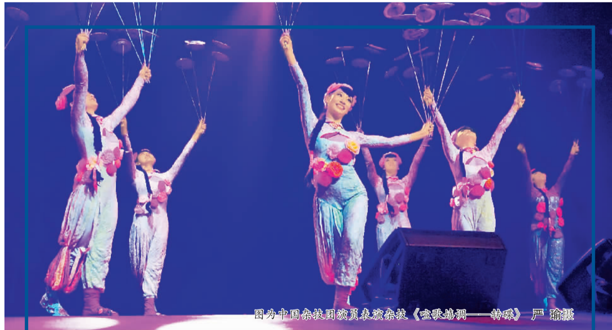
图为中国杂技团演员表演杂技《空歌鸣洞——转碟》。

其二,我也梦想着把生意做好后,回到留学的学校出资成立自己的研究所,招一批博士,继续完成自己未竟的研究。从这个角度看,我的创业也是“曲线救国”,并没有远离我的科研梦。(来源:中国侨网)